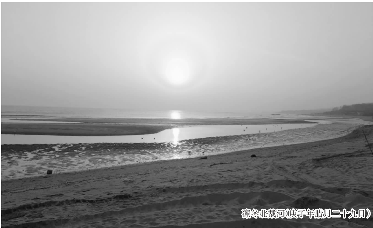
凛冬北戴河(庚子年腊月二十九日)